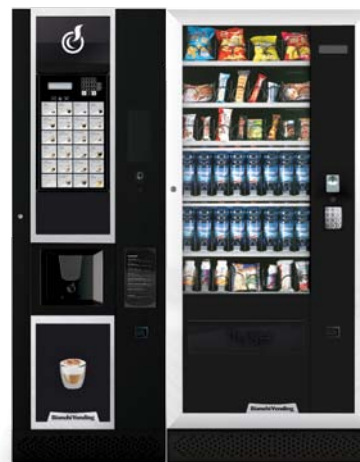
LEI600 EASY + ARIA L MASTER