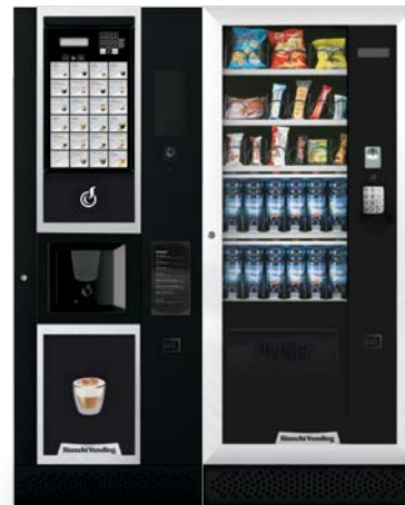
LEI400 EASY + ARIA M MASTER