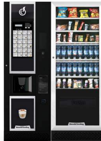
LEI600 SMART + ARIA L SLAVE