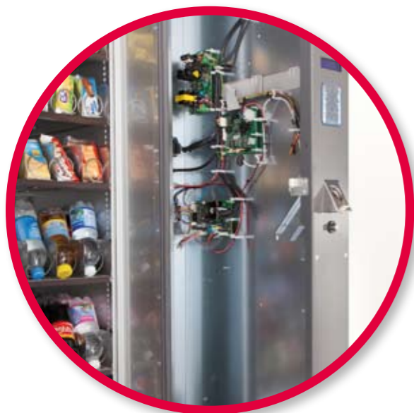
Extractable control panel. Panneau de contrôle amovible.