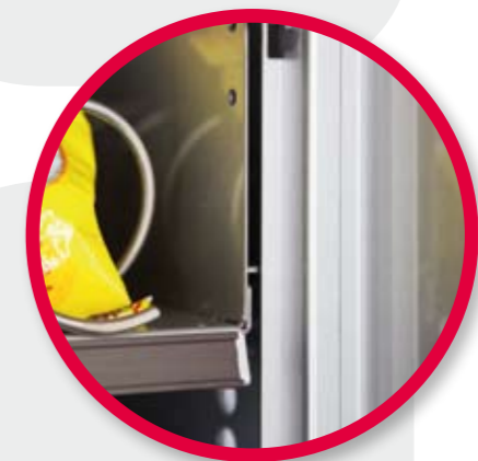
Trays locking system detail.